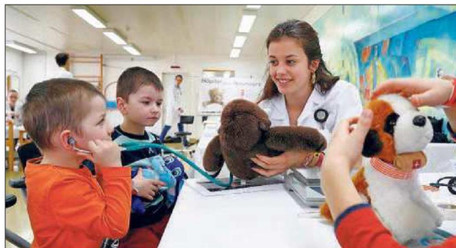
Mis en place dans les locaux de physiothérapie de l'Hôpital du Jura, l'événement pourra accueillir un maximum de 210 enfants venus pour soigner leur doudou et découvrir le monde hospitalier.